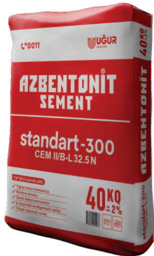
Azbentonit standart 300