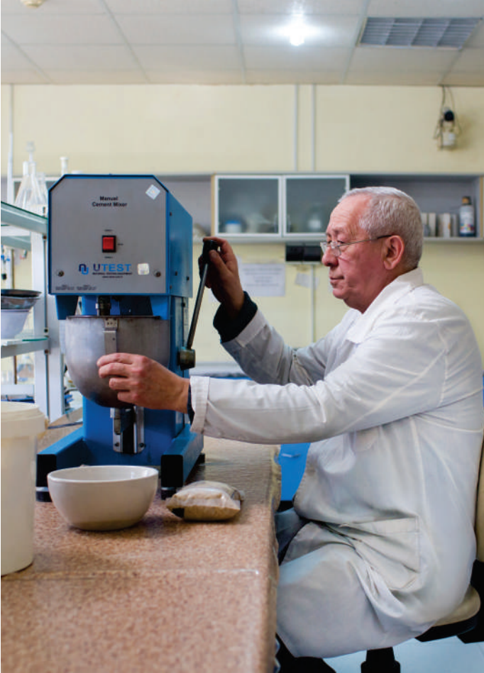
Mexaniki və izolyasiya sınaqları