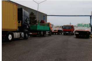
Nəqliyyat mexanizasiya sahəsi