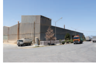
Sement əsaslı məhsullar zavodu