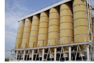
Sement istehsalı zavodu