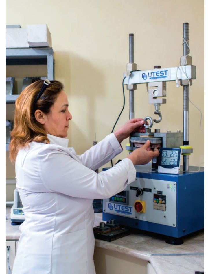
Polimer məmulatlarının sınaqları