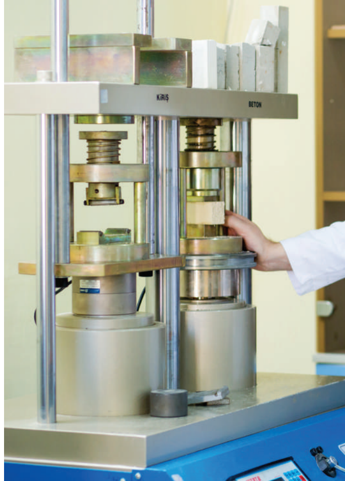
İnşaat məhsullarının sınaqları