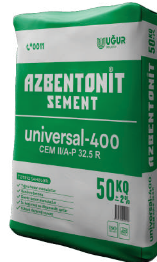
Azbentonit universal 400