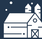
Kənd təsərrüfatı sektoru