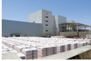
Gips əsaslı məhsullar zavodu